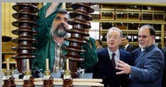
Sampaio numa das paragens de hoje das Jornadas de Inovação

O Presidente da República apelou hoje a uma "ligação profunda" entre as empresas e as universidades e centros de investigação, para que as primeiras possam sobreviver.