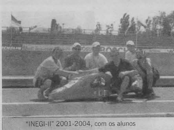
"INEGI-II" 2001-2004, com os alunos