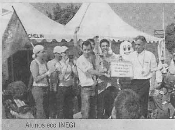
Alunos eco INEGI