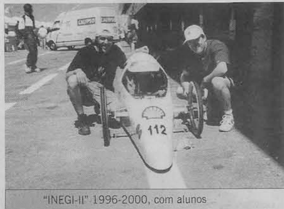
"INEGI-II" 1996-2000, com alunos