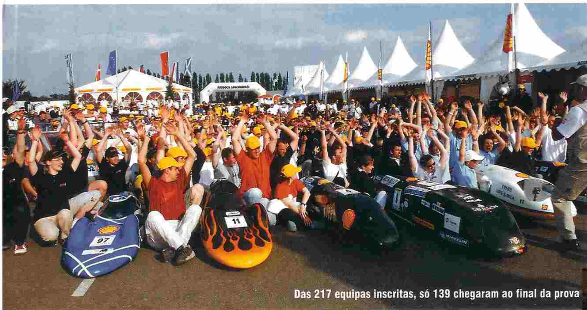
Das 217 equipas inscritas, só 139 chegaram ao final da prova