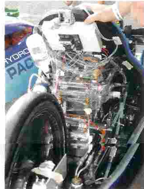
O abastecimento dos veículos é um exercício de precisão