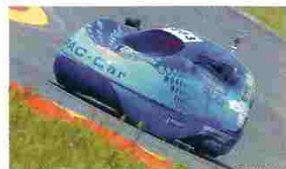
O P@C-CAR foi o melhor entre a categoria emergente dos veículos a hidrogénio