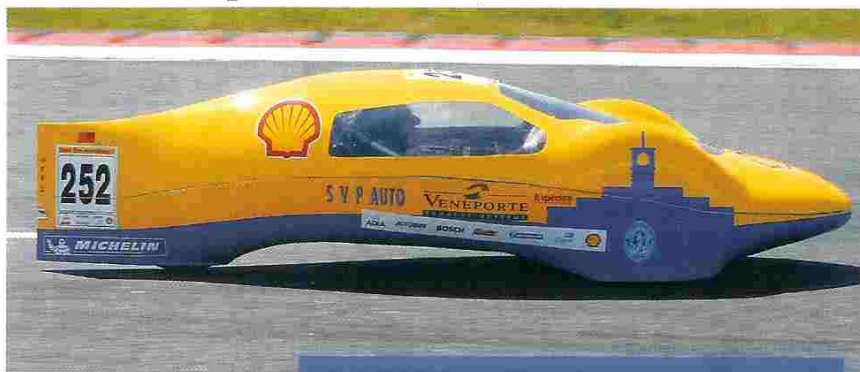
Coimbra foi de novo a melhor equipa lusa e prepara já o veículo para a edição de 2005

As alterações permitiriam, segundo o responsável da equipa,