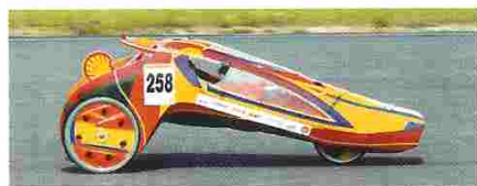
A equipa do Soito participou com um... «sapato alto»