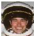
Outras Terras - outras leituras Por Carlos Oliveira