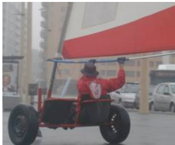
Carros movidos a vento

PUB COFIDIS. Ter até 10.000€ é assim: Claro como água.